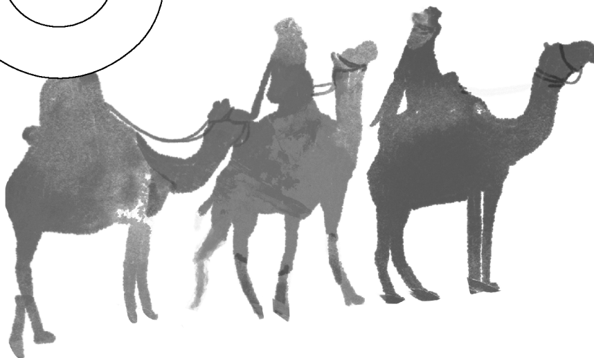
Illustration: Nadine Kristen © Carus-Verlag, Stuttgart