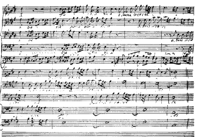
Credo-Schluss und Sanctus in der Handschrift Wagenseils

Außer dieser Partitur (zugleich Orgelstimme) sind Chorpartitur, Violinstimmen, Kontrabaß- (und Violoncello-) stimme erschienen.