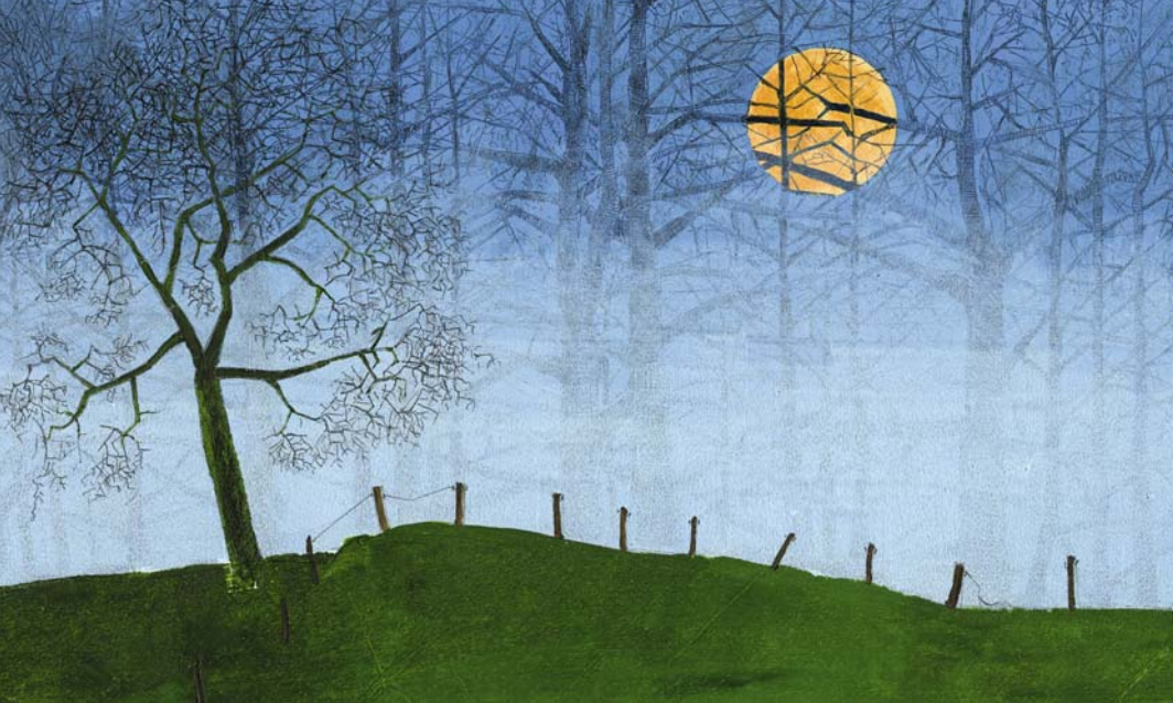
Frank Walka, »Der Mond ist aufgegangen«, aus dem Wiegenlieder-Buch